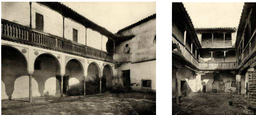
Fig. 1 y 2. Las Casas del Chapiz (h. 1926), sede de la Escuela de Estudios Árabes de Granada, antes de su restauración por el arquitecto Leopoldo Torres Balbás.

La Escuela de Estudios Árabes de Granada fue fundada por Ley de 27 de enero de 1932, aunque su inauguración oficial tuvo lugar el 21 de noviembre de 1932. En un primer momento fue orientada hacia la enseñanza de la lengua y la cultura árabes. Se trataría de dotar de medios a los estudios árabes, en colaboración con la Universidad de Granada, e integrarse