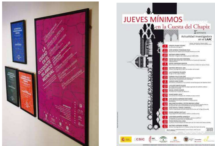
Fig. 10 y 11. Carteles de Congresos Internacionales organizados, y del primer Seminario sobre la Actualidad Investigadora en el LAAC (2010).

La Escuela de Estudios Árabes de Granada lleva a cabo un ciclo de siete congresos internacionales, dirigidos por el Dr. Julio Navarro con el título conjunto “La ciudad en el Occidente islámico medieval. Nuevas aportaciones de la Arqueología y relectura de fuentes”, enmarcados en un proyecto de I+D del año 2003: “Urbanismo islámico en el Sureste peninsular”.