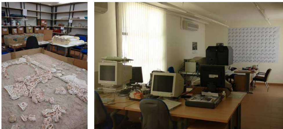
Fig. 6 y 7. Interiores del carmen de los Mínimos, donde miembros del LAAC trabajan con técnicas arqueológicas y fotogramétricas.

Desde sus orígenes se ha procurado dotar al grupo con los necesarios medios, tanto técnicos o instrumentales como humanos, para fundamentar los trabajos de investigación de forma sólida, destacándose los siguientes recursos (fig. 6 y 7):