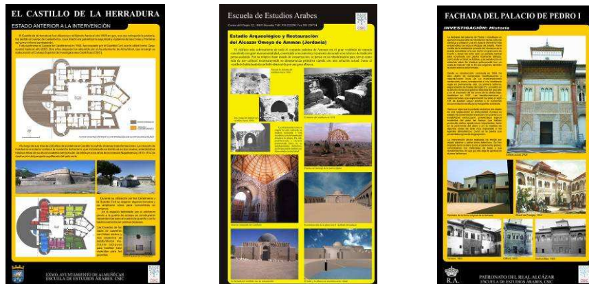
Fig. 8, 9 y 10. Trabajos realizados por miembros del LAAC. El Castillo de la Herradura (Granada), el Alcázar Omeya de Amman (Jordania) y la fachada del palacio de Pedro I en el Alcázar de Sevilla.